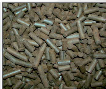
Pelety z odprašků