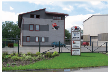
Provozovna Třinec - Konská - výrobní a skladovací prostory